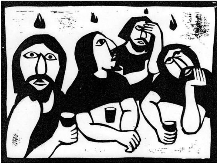
Pinksteren, Flip van der Burgt

“Zend uw Geest uit en alles zal worden herschapen en Gij zult het aanschijn der aarde vernieuwen!”. Ik zou er in deze roerige weken aan willen toevoegen: ... en alstublieft ook het aanschijn van onze lieve kerk! Namens de redactie van Doorgeven groet ik u allen hartelijk en wens u het allerbeste toe!