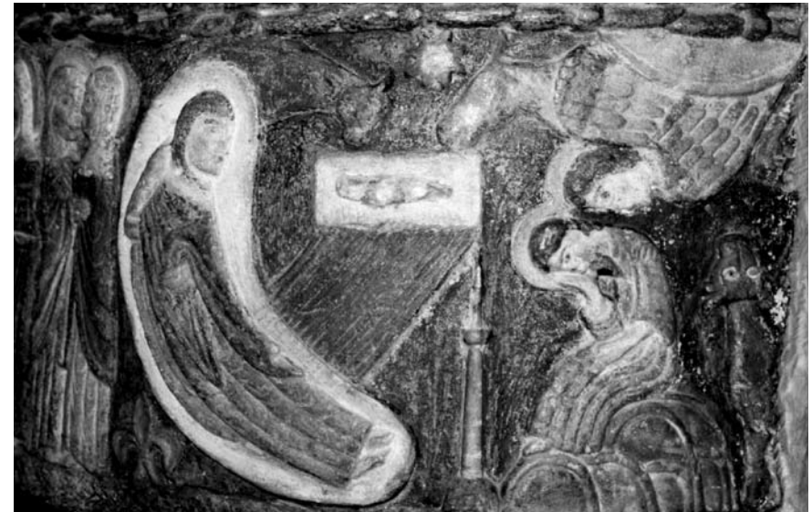
Detail doopvont (12e eeuw) in de kerk van Vall (13e eeuw) op het Zweedse eiland Gotland.

Dit is een fragment (blz.48 en 49) uit het boekje ‘Jij die mij ik maakt’. Oosterhuis schreef het speciaal voor deze Maand van de spiritualiteit. In dertig stukjes, net zoveel als november aan dagen telt, laat Oosterhuis zien hoe jij en ik elkaar kunnen inspireren om de wereld een beetje beter te maken. Het is uitgegeven door Ten Have in Kampen en kost slechts € 2,50.